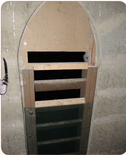
Aménagement d'un abat-son d'église avec un espace suffisant (7 cm) pour le passage des chauves-souris mais empêchant l'accès aux pigeons.