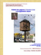
Fidélité des pigeons à un pigeonnier urbain. Catherine Dehay