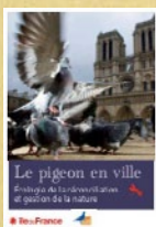
Le pigeon en ville. Natureparif