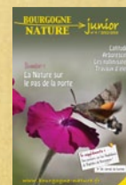
La Nature sur le pas de la porte. Bourgogne-Nature Junior n°4. Bourgogne-Nature

Cette fiche technique est réalisée par :