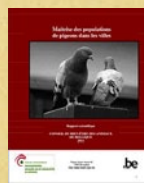
Maitrise des populations de pigeons dans les villes. Conseil du bien-être des animaux de Belgique.